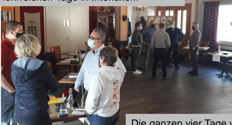
Herzlichen Dank für die wunderbaren lehrreichen Tage in Interlaken.