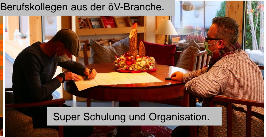
Super Schulung und Organisation.