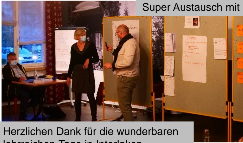
Super Austausch mit Berufskollegen aus der öV-Branche.