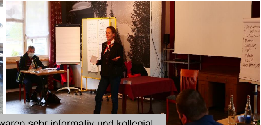
Die ganzen vier Tage waren sehr informativ und kollegial.